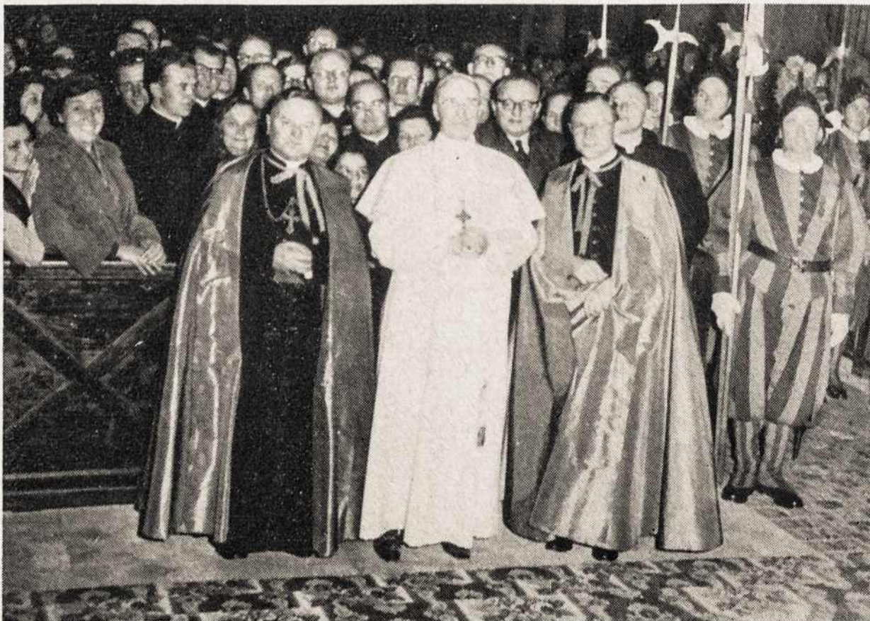
Šv. Tėvas Pijus XII, pašventinęs Nekalčiausios Marijos Širdies statulą Lietuvai, Romos lietuvių tarpe.

Let this Feast of Our Lord's Resurrection, therefore, be the beginning of a new era in the life of the Knights of Lithuania.