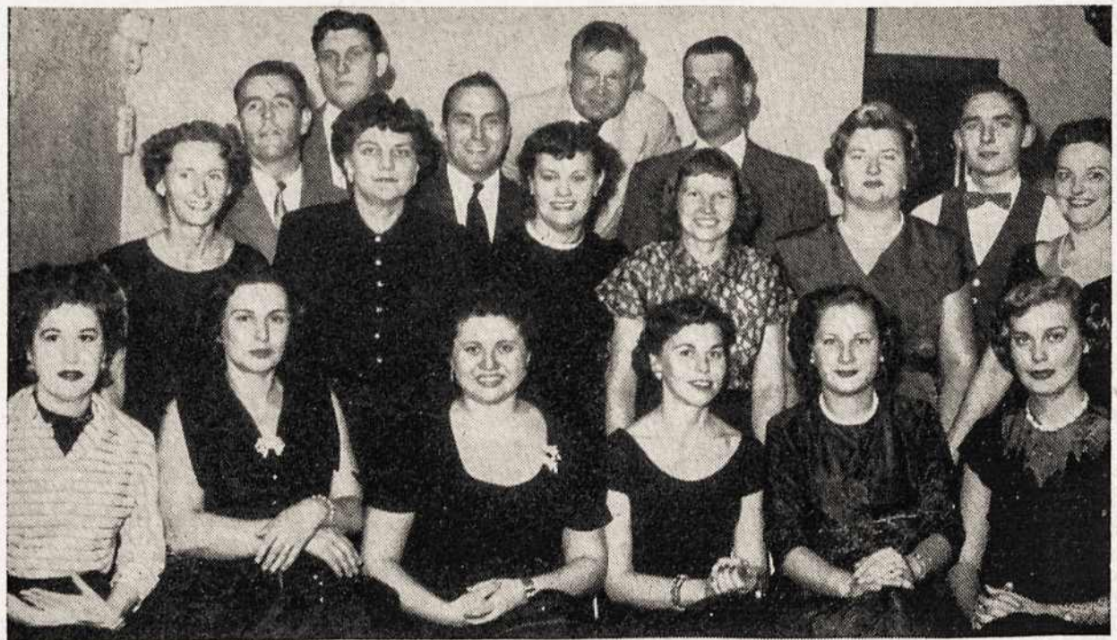
Great Neck, N. Y. Council 109

The success of the Mardi Gras dance was due largely to the support of the contingent of revelers from Philadelphia.