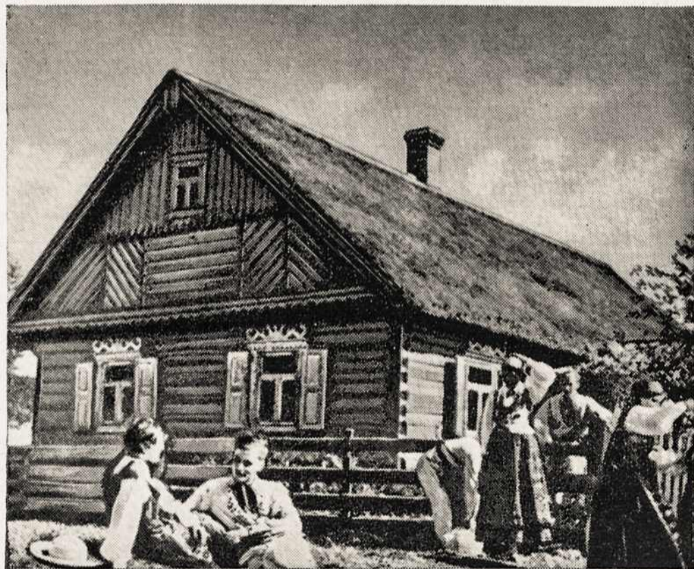
Sekmadienio popietėj laisvos Lietuvos kaime.