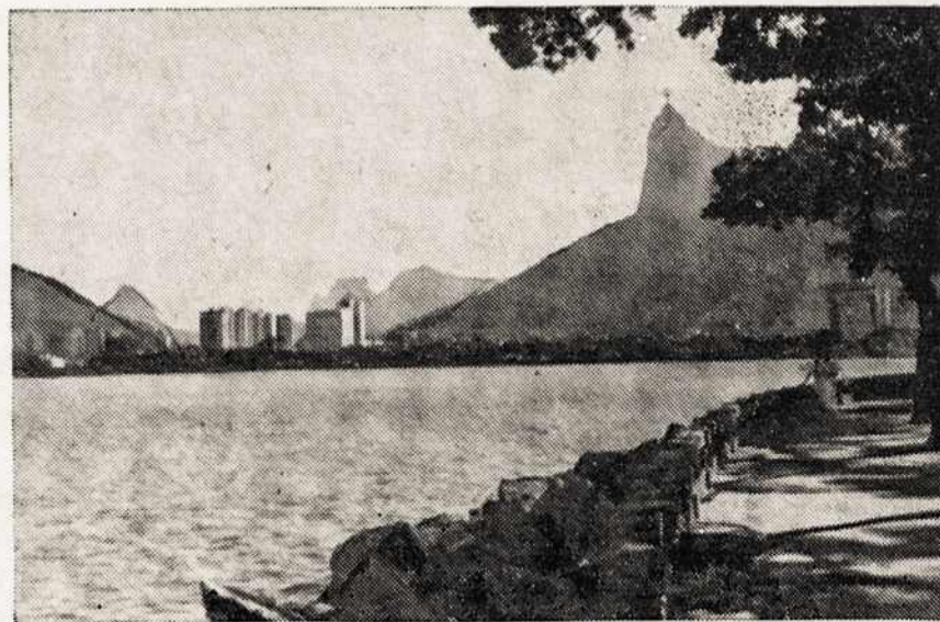
Kalnas prie Rio de Janeiro su Kristaus statula viršuj.

This fall marks the Fortieth Anniversary of VYTIS. We are looking forward to your continued support in making VYTIS the outstanding American Lithuanian youth magazine.