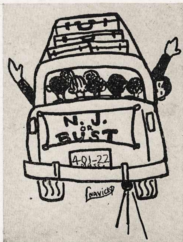
Iki pasimatymo Vyčių Seime!