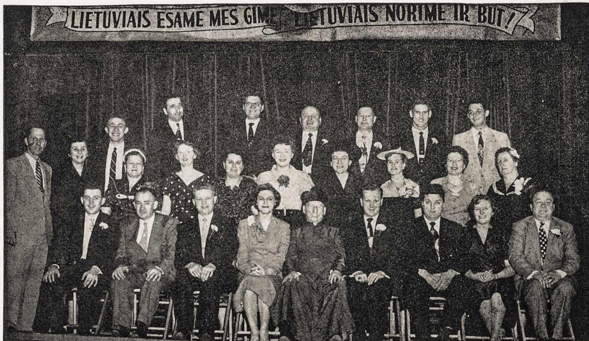
NEWARK, COUNCIL 29 NATIONAL CONVENTION COMMITTEE