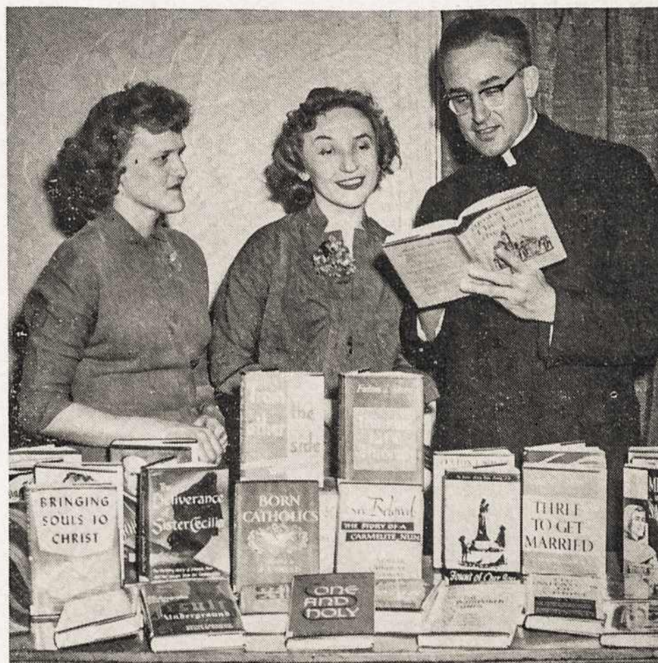
South Boston Tribune

Į tokį Vytišką vakarėlį gauti jaunųjų svečių, kurie iš to užsidegtų vytiškumu ir stotų vyčių eilėms. Todėl čia reikia numatyti aiškia tvarka ir parinkti porą gerų vadovų, kurie galėtų visą vakarą pavairinti, pagražinti ir visus palinksminti. Tik šokiai vyčių Seimuose netinka, nepateisinami ir net žalingi. Šeštadienio vakaras, todėl anksčiau baigiami, rengiamasi Sekmadieniui.