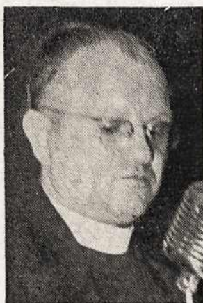
Kun. St. Raila