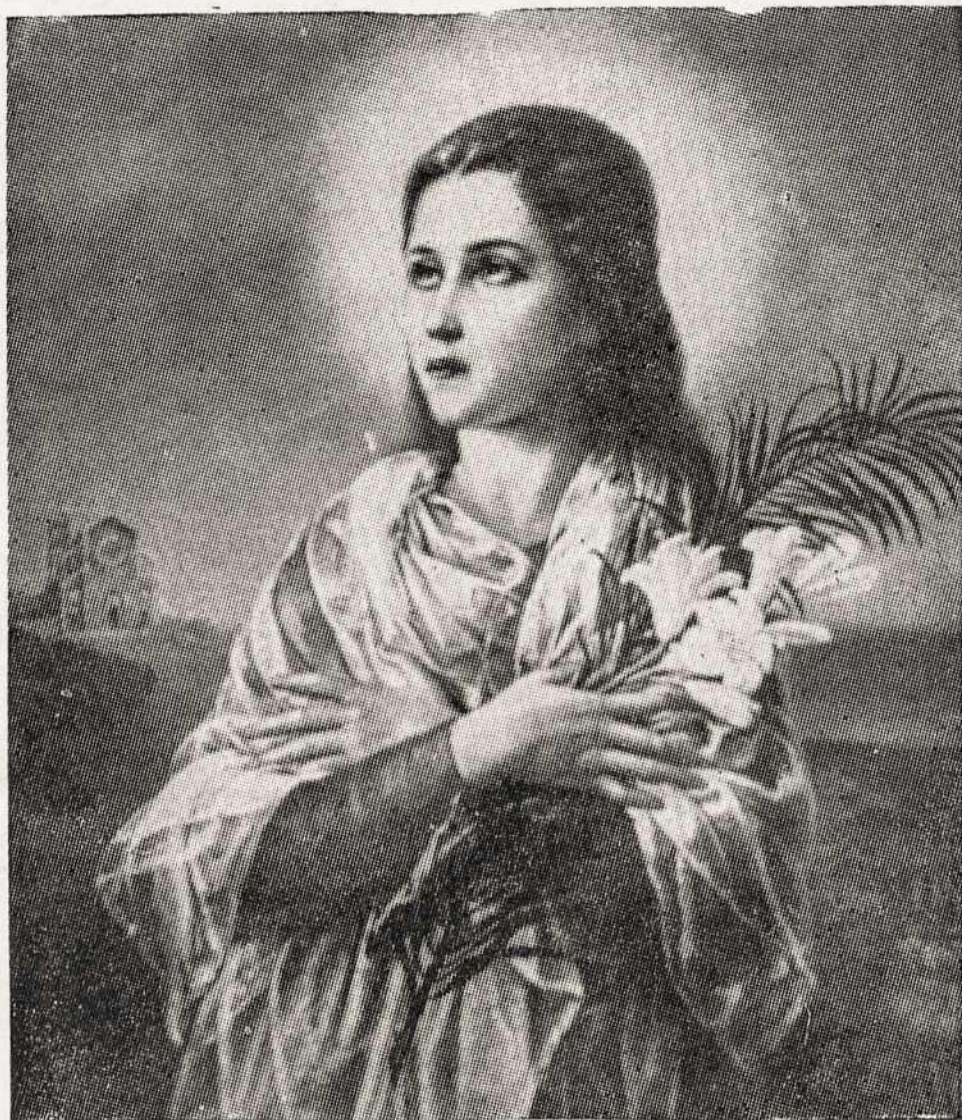
Ar pažistate šią gražią mergaitę? Ji mirė tik prieš 53 metus. Tai šventoji Marija Goretti