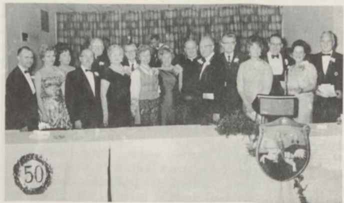
Guests at the Golden Jubilee Banquet of the Illinois-Indiana District's Choir.