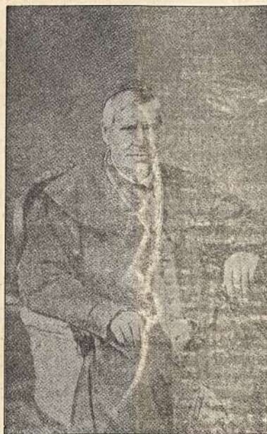
Vyskupas Motiejus Valanczius.