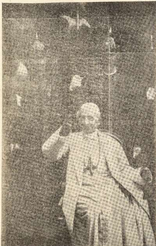
From Harper's Weekly.

pranaszavo taip ir stojosi; - nuizūgo numirė Grigalius XVI o ant jo vietos tapo iszrinktas Giovanni Maria Mastai Ferretti, kuris priemė vardą Pijus IX. Jis Joakimą Pecci pggelė į kardiolus, o po jo smertei Pecci tapo iszrinktas ant visos Baznyczios valdytojo, ir jogei tas viskas iszszpildė, Leonas XIII tiiszo, kad ir paskutinė pranaszystė, kas link jo 20 metų vieszpataavimo, te pgi iszszpildys ir jis numirs nesulaukęs pabaigos XIX amziaus, kada gi pergyveno tą laiką, idant Vieszpaciui Dievui padėkupoči, jis apgarsing jubielių, kurį su didele iszkilme apvaiszcziojo. Tas jubilius pern i buvo apvaiszcziojamas tiktai Ryme. Idant duoti vieszp sv. m. isz yatingų mylistų geriems katalikams