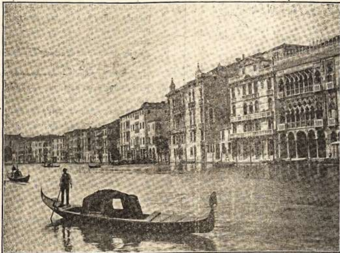
VENECIJOS GATVE IR VEZIMAS.

Senovėje buvo tai sostapilė Venecijos provincijos, su valdžia garsių dožų, kurių dabar da yra ru-