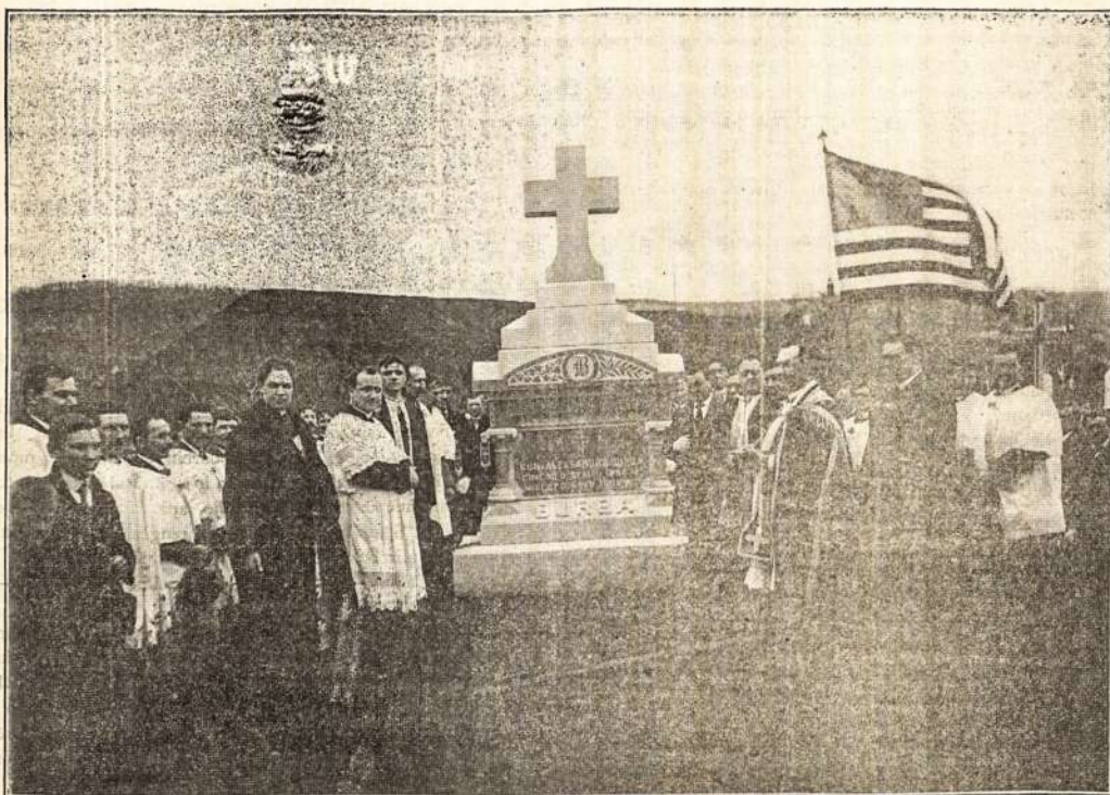
KUN. A. BURBOS PAMINKLAS.

Paszventinimas paminklo atsiliko 27 d. kovo 1901 metų. Ant paszventinimo pribuvo keturios draugystės, vietinės