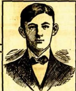
LIGA BUSTOJO. GUOD. PROF. COLLINS: Kaip tikraj pradėjau nasodoti giduoles, kurias del mano pristatodu, tai uz dwieju dienu gelimas widuris, szonia ir apie szirdi swieja nustoję ir esanti gana swejkas. Pristatuciu ant parokajawimo ma no parowelaku. Su atida del Jus TOMI RONKAR , Hoesland, Vil. 2697-112 Place.