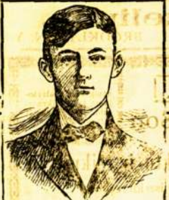
II A GU SHI... Falo (Hija) prad... kurio del manes... sur... an... 1507... N. Y. C.