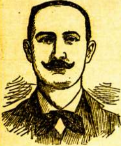
Olyphant, Pa. Kovo 12, 1904 m.

asz gaunu naujus laiszkus nuo ligoniu, kurie yra davadu nesuvylian- czios pasekmes mano vaistu.