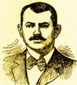
Steubenville, Ohio, Kovo 24, 1904 m.