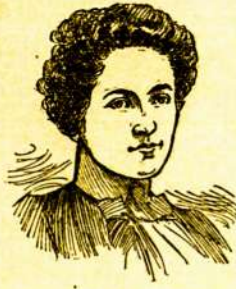
New York, Kovo 7, 1904 m.