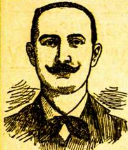
Olyphant, Pa. Kovo 12, 1904 m.

asz gaunu naujus laiszkus nuo ligoniu, kurie yra davadu nesuvylian- czios pasekmes mano vaistu.