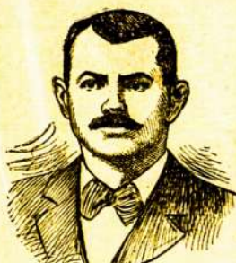
Steubenville, Ohio, Kovo 24, 1904 m.