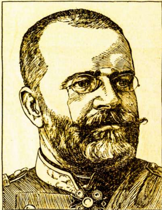
VICE ADMIRAL SKRYDLOFF, MAKAROFF'S SUCCESSOR AT PORT ARTHUR.