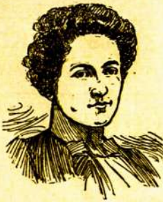
New York, Kovo 7, 1904 m.