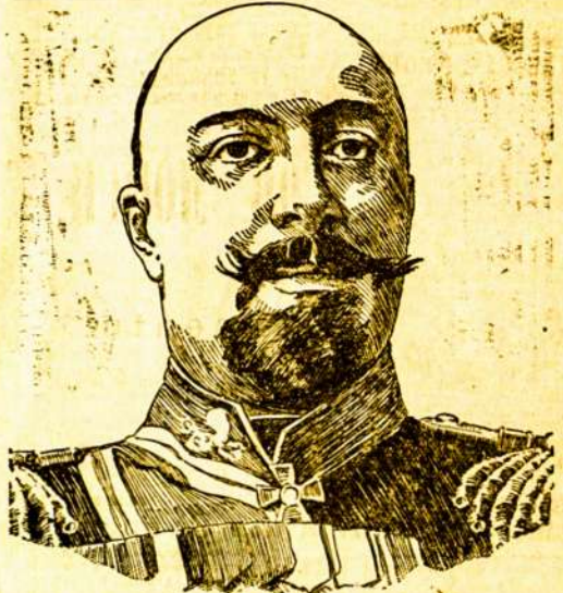
GENERAL STOESSEL, COMMANDANT OF PORT ARTHUR.

In rytų kraštą visos skubėjo. Nes tame krašte kalėjims tvirtas, Storu raudonu apsiaubtas muru, Tę uždarytas kunigs pagirtas Už geležinių juodųjų durų. O, šalis Siaurės, kaip ilgai laukai (Toliaus bus).