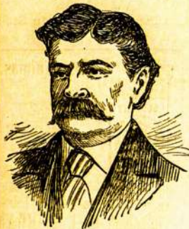
Mano Brangus Profesoriu Collinsas:—

Kožia pačia atgabena padėkavonės laikus nuo dėkingųjų, kurie tapo išgydytais nuo šitos įkrios ligos. Čion yra keli iš šimty kas sanvaitė gaunamų laiškų: