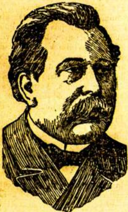
Nužudytasis ministeris von Plehve.

Vietoje, kur buvo užmuštas ministeris, labai daug svieto vaikščioja ir važiuoja, taigi po eksplozijos pasidarė bausis sujudimas. In kelias minutes su bėgę žandarai suareštavojo užmušiką,