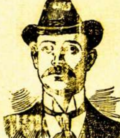
Magn Junction, Ohio.

Brangus Profesorius Collins:— Kam aš niekad netikėjau, kas dabar yra tūtra tiesa. Jūs šlydėte mano nuo mano chroniškių ir pavojingų ligų pūimā ir aš nesuėjau pasidinti išvėrciū mano širdingų padėkavonių ir susidėbėjimų iš jūsų gydymo. Kiekvienas čion šioe. kuoni aš būčiau priėlio mano gydymui pas jus ir jo trizj mėnesių gydymo, aš netik išgydžiau savo ligę bei dar įsijūciai geriau ir smagiau, negu aš jūdiausi prieš apsigimti.