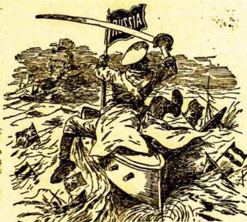
—New York World.

Vėla, toj pačioj dienoj, Strasburg'e, Elsas-Lorainėj, ugnis padarė bledies ant $1.500.000. Gaisras sunaikino našlaičių prieglaudą ir šv. Magdalenos bažnyčią.