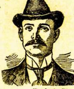
Minco Junction, Ohio.