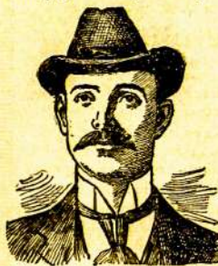
Mingo Junction, Ohio.

Brangus Dže Collins:— Sėpnytos sanvartės atgal nieks pagelbėjo saikyti kad aš gyvensiu. Mano pilvins neruškis ir skausmai širdieno kuone ukšmągė mane. Aš vėmiau po kožnam valgiu su tokia įtaiga, kad būdmas maistas manų, turėjo dėl manų didžiausią pasigalėjimą. Aš nu-ginau daktarus ant daktarų, išleida Rimtas doleris ant visokių vaistų, bet aš negalėjau rasti pagelbos niekur. Viskas iš mano drągų norodė man Tamista. Aš padariau pas jus, aprašydamas savo padėjimą ir dabar, į sėpnytas trumpas sanvartės, nematydamas nė įsug, likau išgydžiau. Tas yra daugelis, negu aš tikėjau. Tas yra pastebėtina, Brangus Dže ir aš niekuomet nepamiršiu jūsų maloningu ir rekomenduojau jus visur kožnam, kurį tik pasįstu.