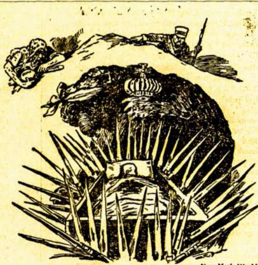
—New York World.

Šitas kartonas parodo visą audrą, kuri laukia caro naujai gimisio kudikio. Jo lopšys apdėtas bagnietais; meška maskoliška, apsiraišiojus žaidzas, karėje gautas, sergsti jį. Iš vienos bet pusės nihilistas su bomba laukia progos, iš kitos japonas, idant naujam carukui atimti sostą.