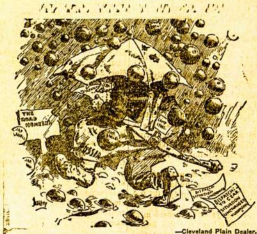
Sitas kartonas apjuokia maskolių nuolatinį pasitraukimą nuo japonų. Kuropatkinas palindęs po parasonu rašo depešas pas carą, juog „situacija ta pati“, o čion ant jo lįja lietus japoniškų bombų („jap shells“).