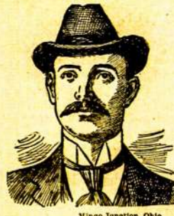
Mingo Junction, Ohio.

Bragans Dr. Collins. Septynios savaitės atgal nieks negalėjo sakyti aš gyvenimo. Mano pilvinis nesveikis ir skausmai krūtines kuom išmągė mane. Aš vėmiau po kožnam valgiu su tokia teigmu, kad kožnos matantis mang, turėjo dėl mano didžiausią pasigailėjimą. Aš nežinau daktarus ant daktarų, šiekdas šimtas dolerių ant visokių vaistų, bet aš negalėjau rasti pagelbos niekur. Vienas iš mano draugų nurodė man Tamistą. Aš parašiau pas jus, aprašydamas savo podėjimą ir dabar, i septynias trumpas savaites, nematydamas nė jaus, likausi išgydyti. Tas yra daugias, negu aš tikėjau. Tas yra pasielbėtas, Bragans Dže ir aš niekuomet nespausiu jūsų maloningumo ir rekomenduoju jus visur kožnam, kurį tik pažįstu.