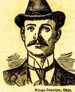
Mingo Junction, Ohio.

Brangus D-r Collins— Septyniuos savaitės atgal nieks negalėjau sukryti, kad aš gyvensiu. Mano pilvitas nepvėikis ir skausmai širdinoje kume užsmaugę mane. Aš vėniau po kožnam vaigtui aš tokia taisyta, kad kožnas matantis mane, turėjo dėl mano didžiausią pasiguilėjung. Aš mėginan daktarus ant daktarų, išdėian šimtus dolerių ant visokių vaistų, bet aš negalėjau rasti pagelivos niekar. Vienas iš mano draugų nurodė man Tamistę. Aš parailan pas jus, spraudamas savo padėjung ir dabar, iš septynius trumpas savaites, nematydamas aš jau, likusiai išgydytu. Tas yra dangiaus, negu aš tikėjusiai. Tas yra pasibėdėtas, Brangus D-r ir aš niekuomet nepasirūšiu jus maloningumo ir rekomenduošiu jus kožnam, kurj tik pažjstu.