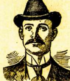
Mingo Junction, Ohio.

Brangus Dže Collins:— Septynios savaitės atgal niekas negalėjo sakyti, kad aš gyvensiu. Mano pilvini nervelkis ir skausmai strėnuose kuomet visamamui mane. Aš vėmiau po kožnam valgiu su tokia tygymu, kad kožmas matastis manų, turėjo dėl manų didžiulį pastojimą. Aš mėginiau daktarus ant daktarų, išvadaus šimtas dolerių ant visokių vaistų, bet aš negalėjau rasti paaušimo niekur. Vienas iš mano draugų nutarė man Taming. Aš paraliaus pas jus, aprašydamas savo padėjimą ir dabar, į septynias trumpas savaites, nematydamas nė jusų, likau išgydytas. Tas yra pastebėtinai, Brangus Dže ir aš niekuomet nepamirėsiu jusų malonigumo ir rekomendacziū jus visur kožnam, kurį tik pažįstu.