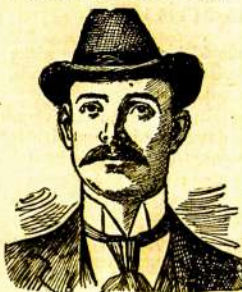
Mingo Junction, Ohio.

Brangus D-rė Collins:— Šeptynis savanvėsi atgal nieks negalėsi sakyti kad aš gyvenau. Mano pūviusis nerolis ir skausmai strimose kuone užsmaugė mane. Aš vėmiau po kožnam valgiu su tokia teisyne, kad kožnas matantis maną, turėjo dėl manęs didžiausią pasigailėjimą. Aš mėginau daktarus ant daktarų, išieciau šimtus dolerų ant visokių vaistų, bet aš negalėjau rasti puresios niekur. Vienas iš mano draugų nurodė man Tamaisa. Aš paraliau pas jus, aprašydamas savo padėjimą ir dabar, į septynis trumpus savavotes, nematydamas nė jusių, likau išgydytas. Tas yra dangaus, negu aš tikėjau. Tas yra pastebėjimas. Brangus D-rė ir aš niekuomet nepamiriu jusi maloningumo ir rekomenduoja jus visur kožnam, kurį tik pažįstu.