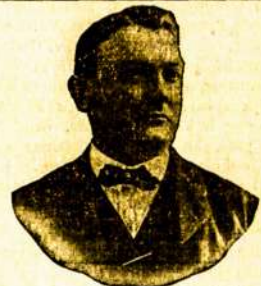
Demokratū partijos kandidatu ant kontroliero yra