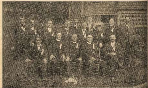
Senasis Susiv. L. R. K. A. Centro komitetas ir XXII seimo viršininkai.