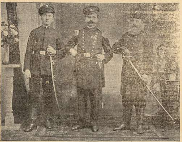
Teatro perstajotyju paveikslai.

Pirmas teatras bus perstajytas naujai lietuviškos visuomenės, 11 Lapkričio (Nov.) 1907 m., New School Hall, 48tos ir Honore gatvių, Town of Lake, Chicago. Vėžinėsim per visus, lietuvių apgyventus, Amerikos miestus ir perstajysime teatrą vardu „Syk-stėnos Raitėlis“. Guodotinos parapijos ir Draugystės, norėdamas parengti perstajytą, malonės kreiptis šiuo adresu: