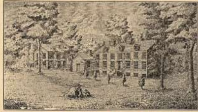
Pirmutinė Philadelphijos Katalikų Bažnyčia.