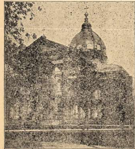
Szv. Petro ir Pavilo bažnyčia Philadelphiaus, dabartinė katedra.

kart' 1851 m. atskirta nuo jos visą vakarinę Pensylvaniją, iš kurios padaryta Pittsburgo dijecezija. 1868 m. atskirta dar keturios dijecezijos. Kur pirm šimto metų buvo viena Philadelphiaus dijecezija, dabar yra 8 vyskupijos, beje Trentono (dabar prijungta prie New Yorko arkidijecezijos provincijos), Wilmingtono (priklausanti prie Baltimores provincijos) ir šešios dijecezijos Pensylvanijos valstijoje, beje, Philadelphiaus, Harrisburgo, Pittsburgo, Erie, Altoona ir Scrantono. Tose dijecezijose 1908 metuose iš viso buvo 1051 bažnyčia, 1847 kunigai, 1,567,921 katalikai, 431 parapijinė mokykla ir 147,324 vaikučiai besimokina tose parapijinėse mokyklose.