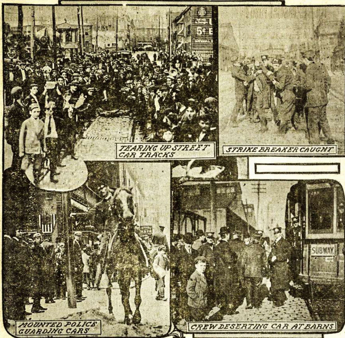
1, Išplėšimas strytkarių rėlių. 2, Straiko laužytoją sugavo. 3, Raitoji policija saugoja tramvajus. 4, Konduktoriai apleidžia tramvajus klojimuose.