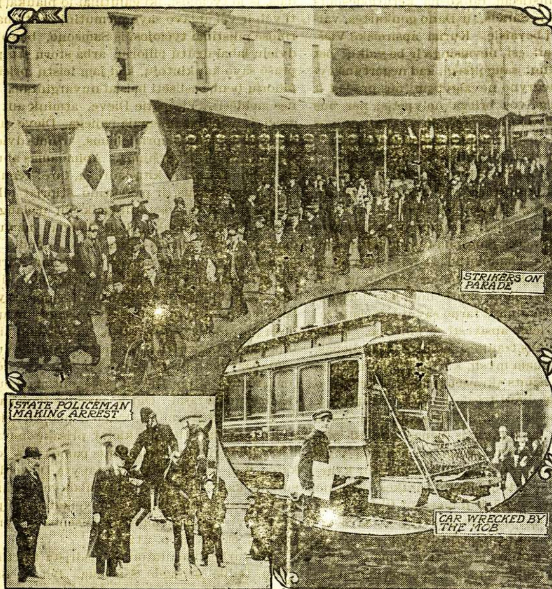
Vaizdeliai iš tramvajų straiko Philadelphijoje.

1, Straikierių paroda. 2, Areštavimas. 3, Minios sudaužytas tramvajus.