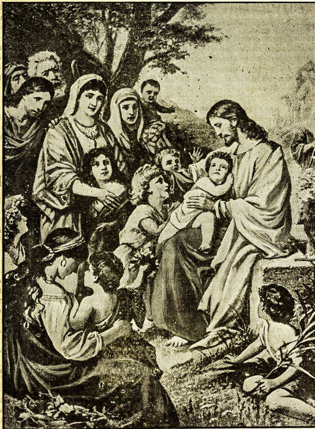
Viešpats Jezus laimina vaikelius,