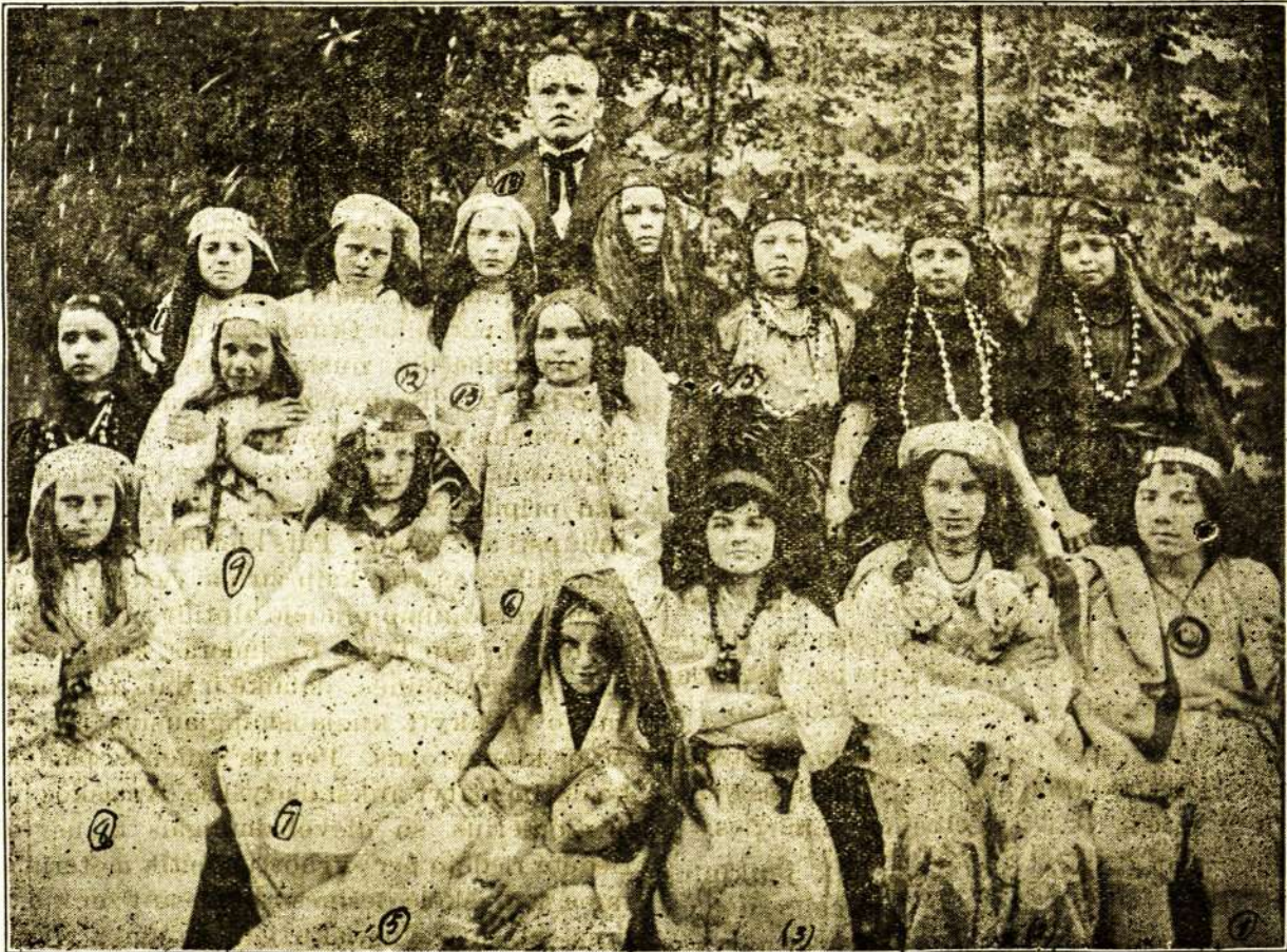
Veikiantieji asmens „šv. Agnetės“ teatro, sulošto 10 d. balandžio šv. Kazimiero parapijos salėje.