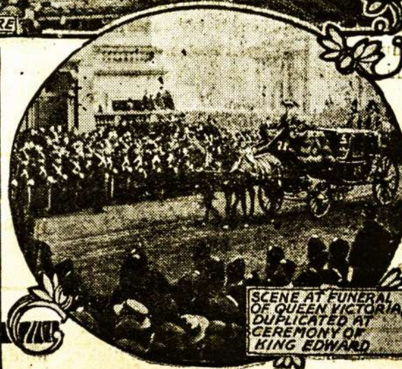
SCENE AT FUNERAL OF QUEEN VICTORIA Duplicated AT CEREMONY OF KING EDWARD