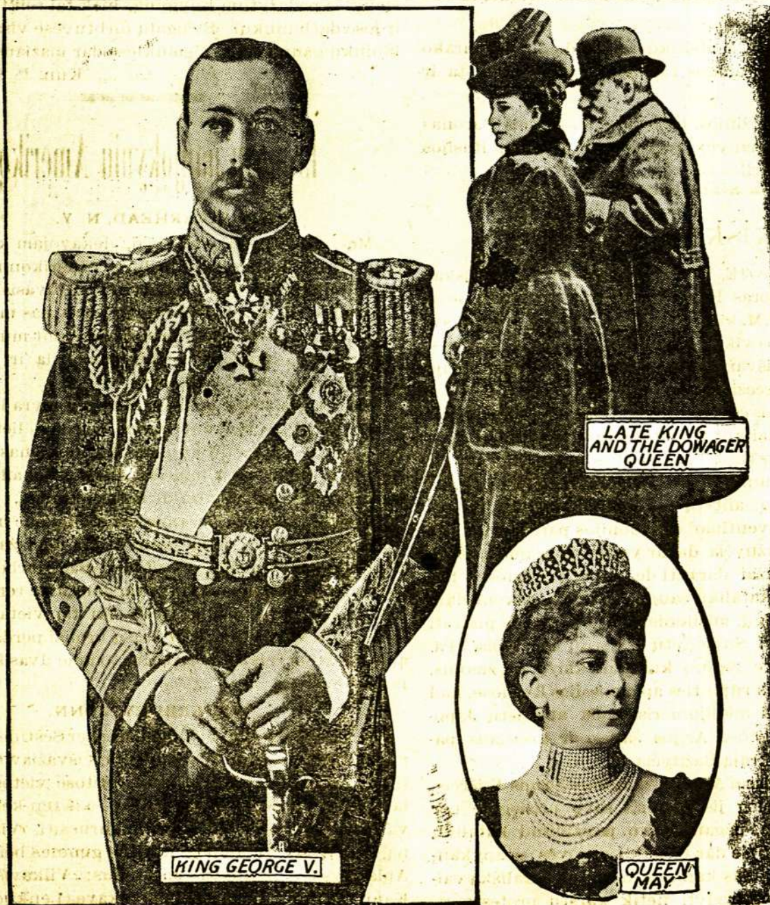
Karalius Jurgis V jo pati — karalienė May. Sanasis karalius su savo pačia.

Menama, naujame parlamente darbininkų partija busianti stipriausia. Kanalejas, rinkimų viršaitis, neužgandintas iš dabartinių rinkimų teisių. Ilgainiui jis žada pasidaruoti, kad kunigams ir vienuoliams suvis nebūtų leista dalyvauti atstovų rinkimuose, tarytum, tie nebūtų šalies pyliciais. Bet Ispanijos katalikai netokie nuolaidūs, kaip prancūzai ir, reikia tikėtis, prie tokių neteisinių reformų neprileis bedievijos šalininkus.