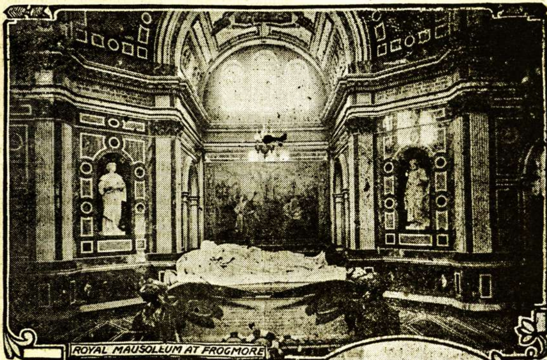
ROYAL MAUSOLEUM AT FROGMORE