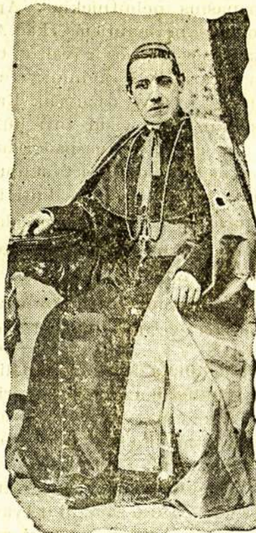
Kardinolas Mery del Val.

Kardinolas Mery del Val, šv. Tėvo Sekretorius, dabar uoliai darbuojasi, kad apgintų katalikybės reikalus Ispanijoje ir Portugalijoje, nuo laisvamanių pasikėsimų. Tarptautiškojo laisvamanių kongreso Bruxellėje (Belgijoje) visų šalių laisvamaniai nusiuntė pasveikinimą darbatiniam Ispanijos premijerui Kanalejas'ui ir ragina jį toliau drąsiai kovoti prieš katalikus. Ant ateinančios savaitės Katalionijos (Ispanijoje) katalikai rengia apie 200 demonstracijų, kad išreikštų savo ne užganėdinimą premijerui, bet šio sėbrai laisvamaniai, ypač Barcelonos apielinkėje, žada katalikus vėl žudyti. Kariumenė pašaukta tvarkos užlaikymui.