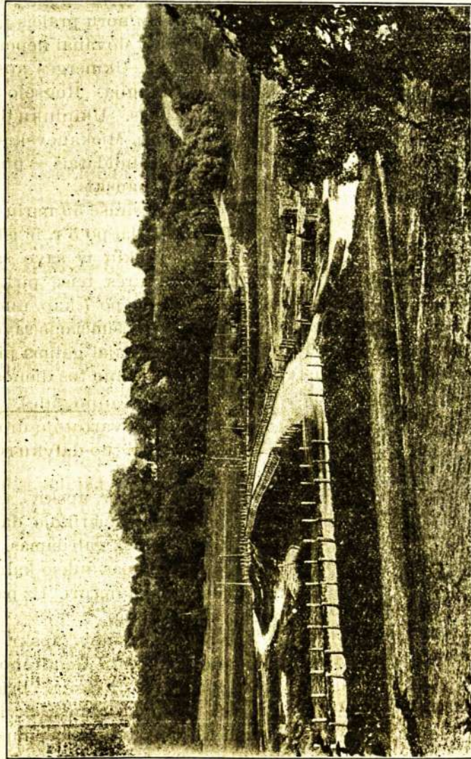
Slėnis Minijos upės ties Gardžiais, Telšių apskr., Kauno gub. (Iš Lietuviško Albumo.)

Kas iki 1 d. gruodžio nori gauti L. Albumą, kainuojantį $1.50, teprišiučia prenume- rata už „Zvaigždę“ 18 mėnesių $3.00, gaus per pusantrų metų „Zvaigždę“ ir dovanų Lietuvišką Albumą.