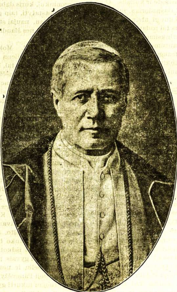
POPE PIUS X.

Sv. Tēvas Pius X, sunkiose valandose valdo dabar Kristaus Bažnyčią. Prancūzijas valdžia neseniai toki smūgi uždavē katalikų tikėjimui, Portugalijs ta pati padarē, ir Ispanijos dabartinē valdžia šiaušiasi ant katalikų. Iš kitos pusēs tarp pačių katalikų visose šalyse atsiranda daug paklydėlių, kurie nenori klausyti Kristaus vietininko balso.