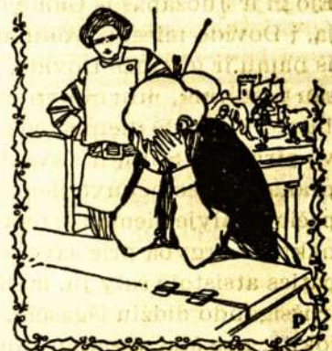
„Sesute, kodėl nežaidi?”

— Teip aš atsimeu, pratarė jaunikaitis, buvo tai Kalėdų vilija, lygiai tokia jau naktis kaip šita, kada tas atsitiko. Išties tokia nētikėsiana pradžiugintų kiekvieną, tik ne bediną asmenį, o vienok aš laiminu jį už tai, kad įnešė saulės spindulėlį tavo gyveniman. Papasakok dar kartą, miela Alisa, tą visą prietikį. Aš taip mėgstu klausyti