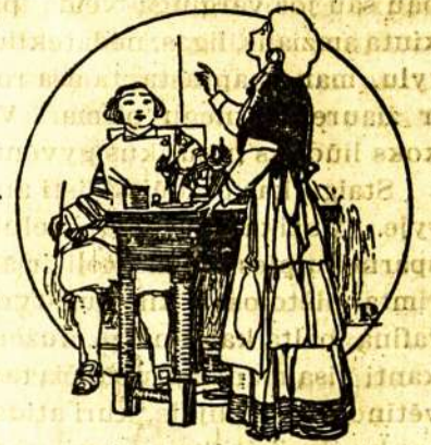
„Tai buvo aniolas“!

Visų tautų žmonės, kurie turi šioki toki turta, mirdami užrašo šį tą labdarybei. Mes gi lietuviai dar nei nepamisljom apie tokią gerą madą. Musų ir turtingesniem-