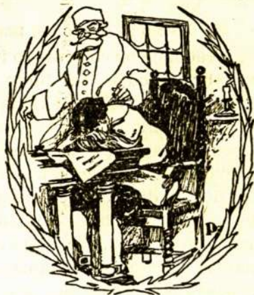
„Ho, ho!“ sušuko kapelmeisteris.

čia? Ar nori ant amžių pasilikti pasmerktu? Eikš! Salin juodos peteliškės Kučių vakare! Ziurėk! Miestas apsidaręs vestuvių rūbais, varpai linksmi gaudžia ir jau, belaukiant pusiaunaktų, visos gatvės pilnos mungucijos kumpių ir riebių kepsnių kvapo. Neužilgo smuklės apšvies savo langus ragindamos praeinančius už-eiti į vidų. O kas svarbiausia. Jo Malonybės izdininkas nepamiršo išmokėti mano algą. Eikš, bičiuoli, einava į miestą!