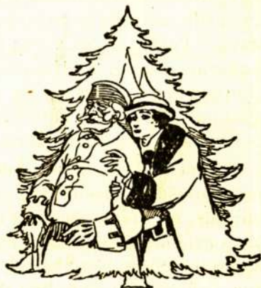
„Cit, sako jis, klausyk!”

Cit! sako jis, klausyk! Joakimas, pasitaisė pakreipė ausį ir prie didelės tylos išgirdo iš kaimyninio namo silpnus, liūdus suklerusio pianyno balsus. Abu draugu stovėjo ramiai, tarytum prie žemės priaugę. Jaunasis pažino melodiją, ir pilnomis ašaru akimis pažūrė į draugą prabilo: „klausyk, Joakimai”, jug tai mano pirmosios simfonijos andanta. O! Aš buvau neišmanėlis, keikdamas prieš keletą valandų savo prilikimą! Dievas yra geras, ir gyvenimas yra šio-to vertas, jeigu