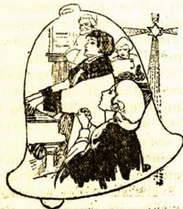
Ji klausė su visa savo siela.

Ak kaip jis virpėjo, giedojo, verkė, juokėsi ir dūsavo pakarčiais! Teip, teip, tai buvo ta pati, ką ji metai atgal girdėjo prie mirštančios tetos patalo. Kada muzikės balsas pasklido po kuklų kambarėlį, štai atspiešė ant mergelės veido neapsakomo džiaugsmo atsindys. Susiėmus rankas, lūpas pravėrus, savo urogenčias akis pakėlus augštyn, laikydama kvapą, klausė su visa savo