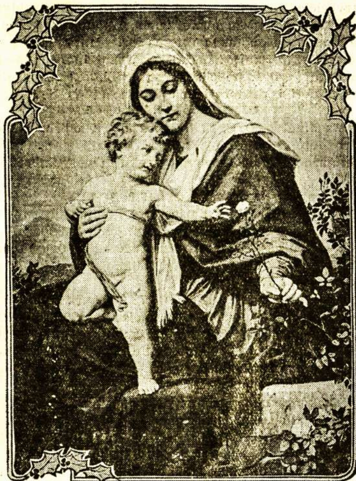
MARY AND THE INFANT JESUS.

New Yorke, N. Y. Panedėlyje. 19 d. gruodžio lošiant „The queen of the Highway“, Am phion teatre, Williamsburge, pasileido netikėtai iš klėtkos vilkas. Iš pradžių manyta, kad tas žvėris turės oia taipgi kokią rolę tarp lošikų ir smagiai suplota jam delnais. Bet netrukus juokai