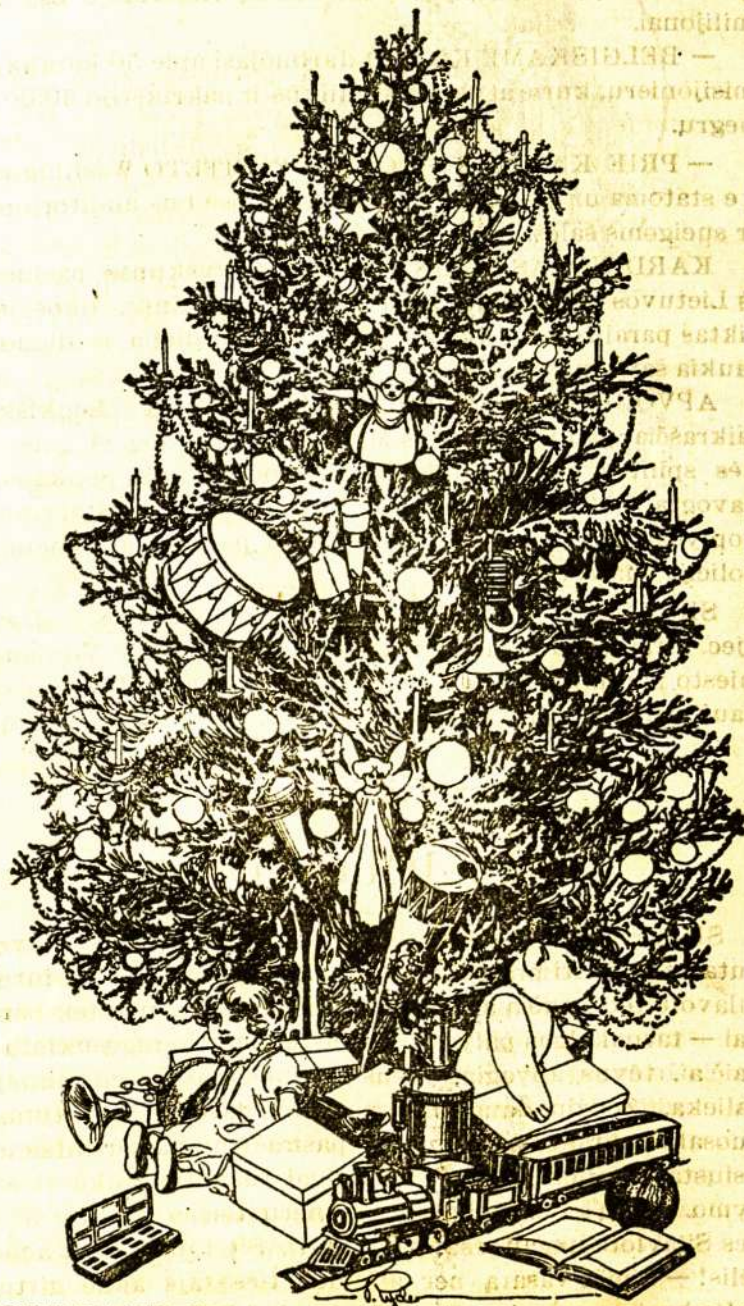
KALEDU EGLELEF, kurios laukia visi „Zvaigždės“ skaitytojų vaikučiai.

LIETUVIŲ MOTERŲ REIKALAI. Nuo Naujų Metų