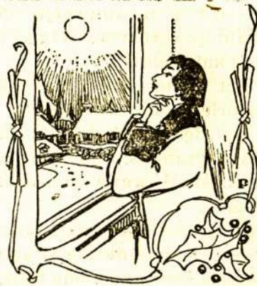
Duokite man įkvėpimą.

—O naktie! suniurnėjo muzikantas pasiremdamas su alkunėmis ant langinyčios — o paslaptingasai mėnuli, jūs mano prieteliai! Aš suprantu visą, ką jūs į mane kalbate. Šią naktį mokinaite mane atsidadavimo Dievo valiai, aš niekad to nepamiršiu! Duokit man įkvėpimą. Nusileiskite ant manęs su visu savo išdidybės valkiu bei ramia iškilme, idant galėčiau apie jus pasakoti ir išreikšti jums nemaringą grožę tam vargšui kūdikui, kuris jus niekad nematė.