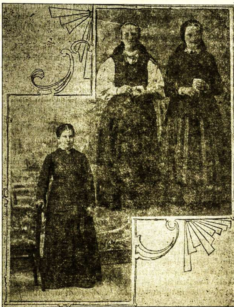
JAUNAMARTES (iš Lietuviško Albumo).

Kas iki šv. Kazimierui nori gauti L. Albumą, kainuojantį $1.50, teprišiuočia prenumeratą už „Zvaigždę“ 18 mėnesiams $3.00, gaus per pusantrą metų „Zvaigždę“ ir dovaną L. Albumą.