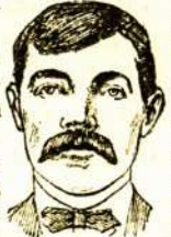
skaudėjimo blauzdose. Dar kartą sakau, nemažai esu dėkingas už sveikatą. Jos. Turkeviče, 695 Sheridan Road Canal, Wilmette, Ill.

Esu labai dėkingas už geras gyduoles, kurios man pagelbėjo nuo užsikrečiamos ligos, nes vos penkioliką dienų pavartojau ir jau jaučiuosi gerai. Labai dėkingas už gerą daktaravimą.