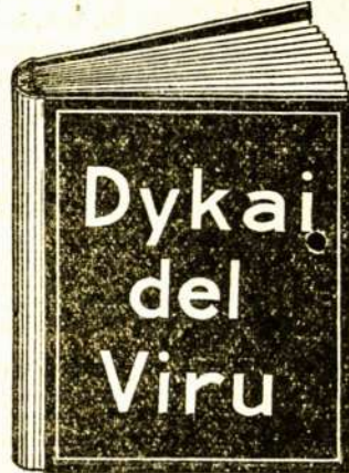
Ta dykai gauta knyga yra vertės $10.00 kožnam sergančiam vyrui.

Kožnas vyras be atidėlioma tur pareikalauti vieną iš tu stebuklingu knygu. Vyrui, katrie žada apsivesti — vyrui ligoti — vyrui, katrie pasigerė per miera, katrie pareidava namo viela ir katrie pervirš dave sau valę — vyrui silpni, nervouti ir katrie prasto sava sveikata — vyrui, katrie negabė pri darba ir katrie ne galė nanduoti pynai linksma gantos — vysai tie vyrui tur pareikalauti vieną iš tu dykai duetu knygu. Ta knyga pasakis kaip vyrui naikin sava sveikata, kaip jie užsikrėta ligoms ir kaip jie gal pynai sugražinti sava sveikata, stipruma ir energiškuma į trumpa laika ir su mažais kaštais. Jeigu nori buti vyras tarp vyru ta knyga pasakis kaip gali tą pasėkti.