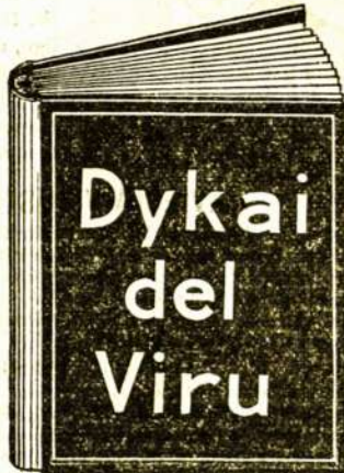
Ta dykai gauta knyga yra vertės $10.00 kožnam sergančiam vyrui.

Kožnas vyras be atidėlioma tur pareikalauti vieną iš tu stebuklingu knygu. Vyras, katrie žada apsigyventi—vyras ligoti—vyras, katrie pasigėrė per miera, katrie pareidava namo vielai ir katrie pervirš dave sau valie—vyras silpni, nervuoti ir katrie prasto sava sveikata—vyras, katrie negabė pri darba ir katrie ne galė naudoti pynai linksnuma gumtos—vysai tie vyras tur pareikalauti vieną iš tu dykai duotu knygu. Ta knyga pasakis kaip vyras naikina sava sveikata, kaip jie užsikrėtė ligoms ir kaip jie gal pynai sugražinti sava sveikata, stipruma ir energiškuma į trumpa laika ir su mažais kaštais. Jeigu nori buti vyras tarp vyrų ta knyga pasakis kaip gali tą pasėkti.