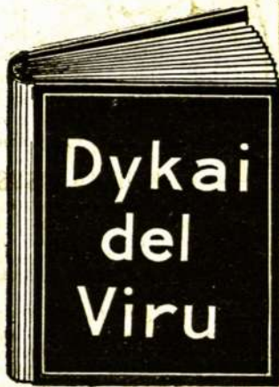
Ta dykai gauta knyga yra vertēs $10.00 kožnam serganciam vyrul.

nas, nevedēs arba apsivedēs, ligotas arba sveikas tur žinoti. Ne naikinkiet sava sunkei uždyrbtus piningus, mokedami už nekingas, bevertēs vaistus ikikolaik neparskaitistē tą knyga vysai. Knyga ta užēdys jums daug dōle-riu ir pasakis kaip galete stotis tvirtu ir resnu vyru. Ątmink į tą, jog ta knyga yra siusta jums vysai dykai. Mes užmokam ir už paczta. Nekokie varda medikališka arba daktariška nera ant konverto. Ne vienas nežinos kas tas yra tyk jus. Išrašikiet sava varda ir pavarde ir adresa aiškei idēkiet ta dikini kupona ir prisiuskiet mums o gauste tą knyga.