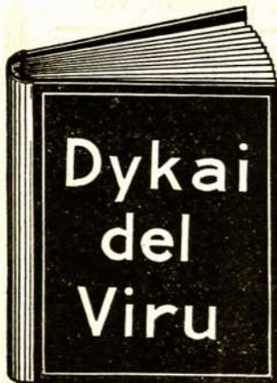
Ta dykai gauta knyga yra vertės $10.00 kožnam sergančiam vyrui.

Kožnas vyras be atidėlioma tur pareikalauti vieną iš tu stebuklingu knygu. Vyrai, katrie žada apsigesti—vyrai ligoti—vyrai, katrie pasigėrė per miera, katrie pareidava namo vielai ir katrie pervirš dave sau valių—vyrai silpni, nervuoti ir katrie prastoji sava sveikata—vyrai, katrie negabė pri darba ir katrie ne galė nauduoti pylnai linksumama gamtos—vysai tie vyrai tur pareikalauti vieną iš tu dykai duotu knygu. Ta knyga pasakis kaip vyrai naikina sava sveikata, kaip jie užsikrėta ligoms ir kaip jie gal pylnai sugražinti sava sveikata, stipruma ir energiskuma į trumpa laika ir su mažais kaštais. Jeigu nori buti vyras tarp vyru ta knyga pasakis kaip gali tą pasėkti.