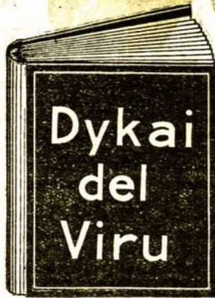
Ta dykai gauta knyga yra vertės $10.00 kožnam sergančiam vyrui.

Kožnas vyras be atidėlioma tur pareikalauti vieną iš tu stebuklingu knygu. Vyrui, katrie žada apsivesti—vyrui ligoti—vyrui, katrie pasigėrė per miera, katrie pareidava namo vielai ir katrie pervirš dave sau valie—vyrui silpni, nervuoti ir katrie prasto sava sveikata—vyrui, katrie negabė pri darba ir katrie ne galė naudoti pynai linksmuma gamtos—vysi tie vyrui tur pareikalauti vieną iš tu dykai duotu knygu. Ta knyga pasakis kaip vyrui naikin sava sveikata, kaip jie užsikrėta ligoms ir kaip jie gal pynai sugrąžinti sava sveikata, stipruma ir energiskuma į trumpa laika ir su mažais kaštais. Jeigu nori būti vyras tarp vyru ta knyga pasakis kaip gali tą pasėkti.