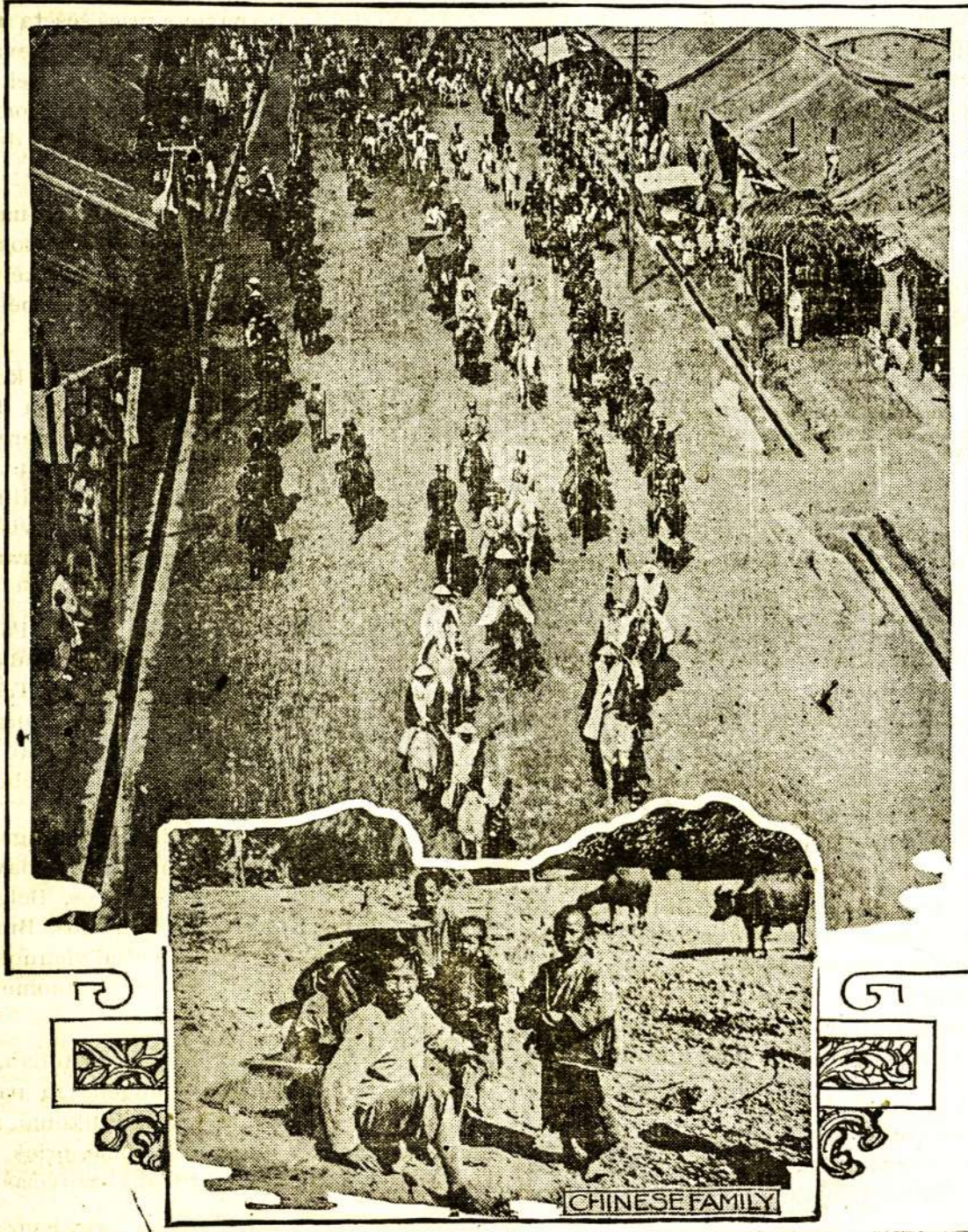
Vaizdeliai iš Kynų gyvenimo.