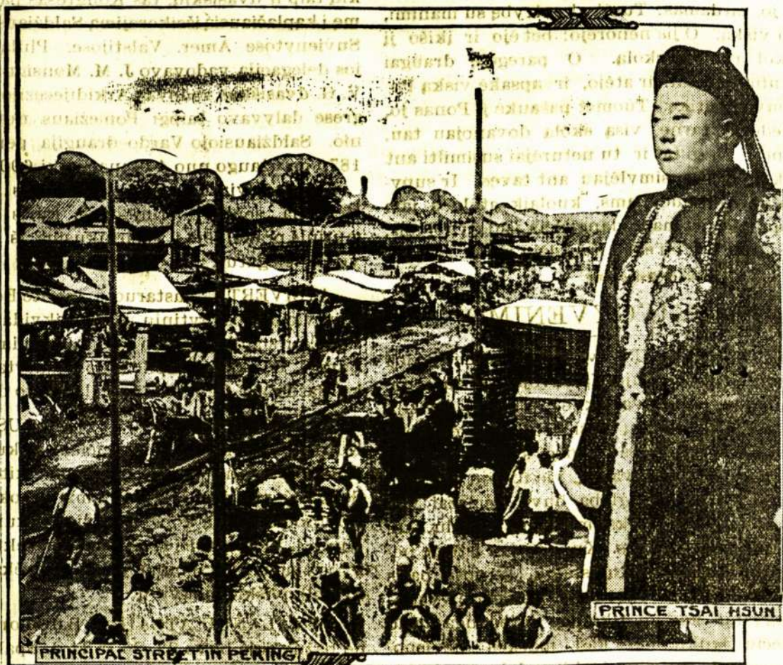
PRINCE TSAI HSUN

Viriausia gatvė Pekine ir kunigaikštis Tsai Hsun. Kynų revoliucionieriai, pasikatinti savo paseikimais pietinėse provincijose, grumoja paimti pačią sostinę — Pekiną. Randas telkia kareivius, kad atsiginti prieš revoliucionierius. Kalbama, būk kudiki-imperatorių jo dėdė Kunigaigštis Tsai Hsun išvežes į Tientsiną, apsaugojimui jo gyvybės.