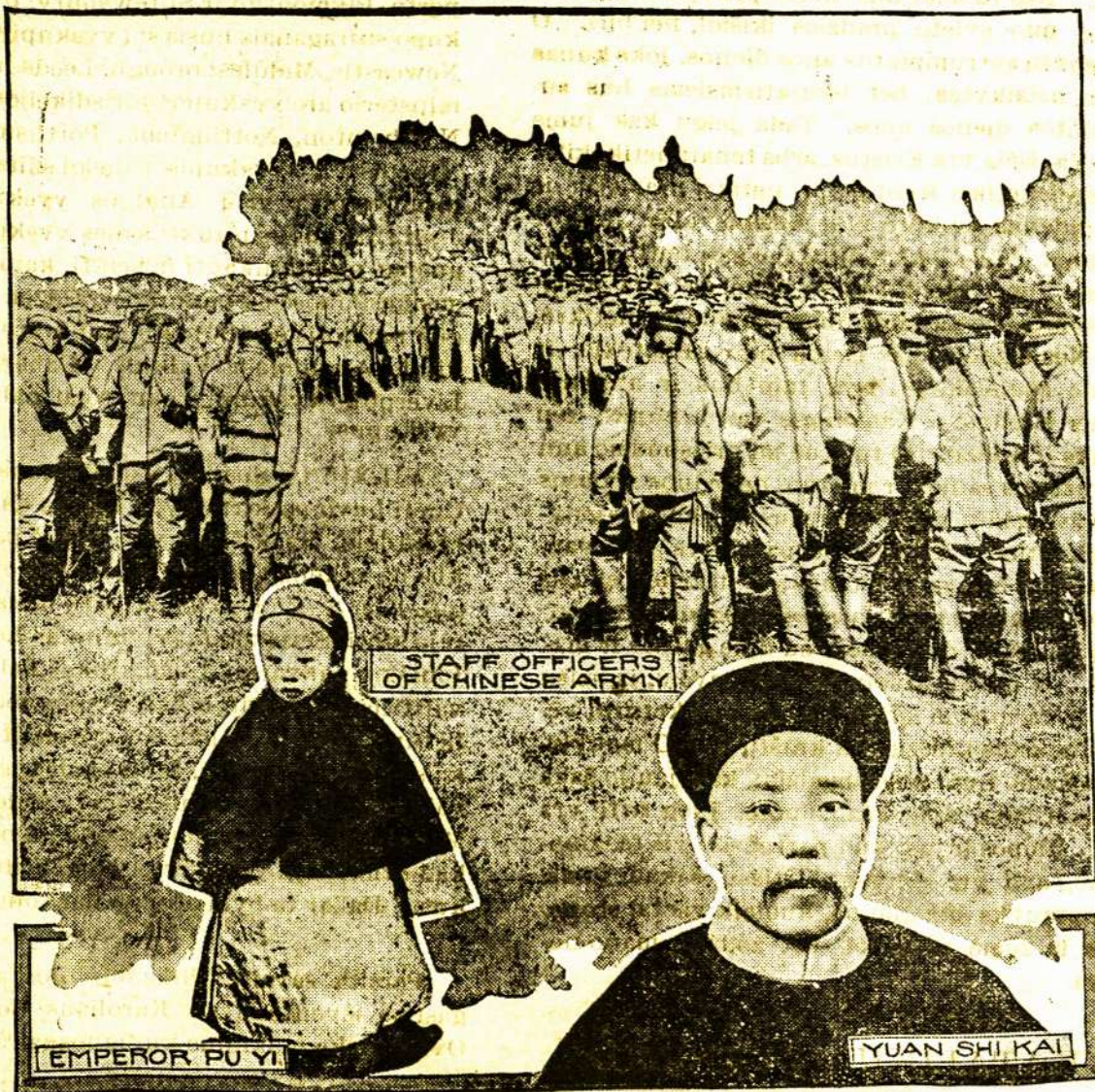
Kynų armijos vyriausieji aficieriai; vaikutis-imperatorius Pu Yi; dabartinis Kynų premieras Yan Shi Kai, vienatinė Mančū Dinastijos viltis.

(KARAI) 1911-1912 m. Mančū Dinastijos pabaiga. Kynų armijos vyriausieji aficieriai; vaikutis-imperatorius Pu Yi; dabartinis Kynų premieras Yan Shi Kai, vienatinė Mančū Dinastijos viltis.