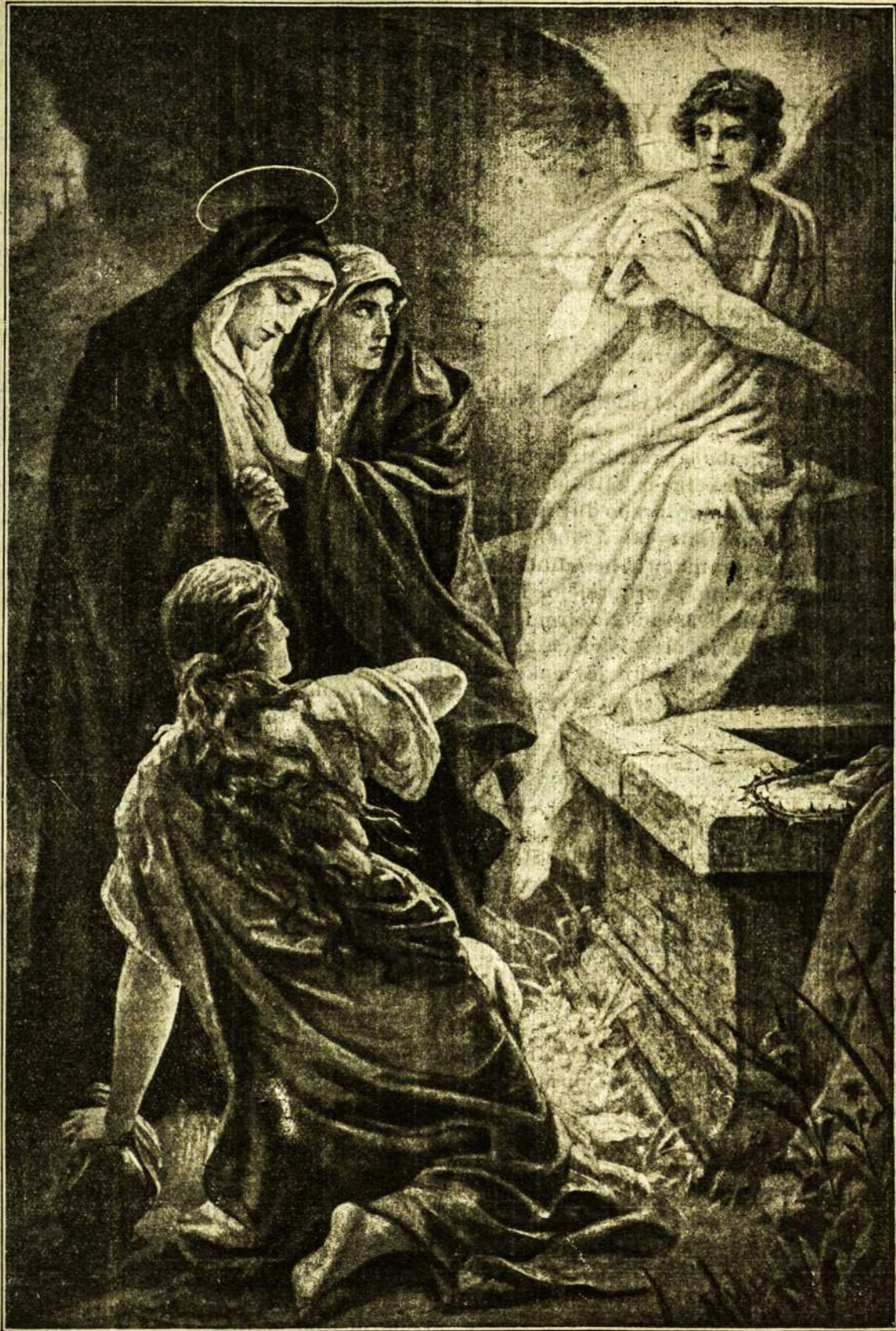
„KRISTUS KELES, NĒRA CIA JC — STAI VIETA, KAME BUVO PAGULDYTAS”.