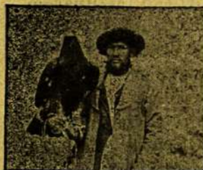
Kirgizas su sakalu.

Orenburgo miestas už 727 viorstų nuo Maskvos, išstatytas prie Uralo upės, kurios kitoje pusėje prasideda didėji Azija, žmonių giminės lopšys. Per šį miestą eina Rusijos vaizba su Chiva, Buchara ir Taškentu. Gelžkelis iš Orenburgo į Taškentą buvo užbaigtas 1905 metuose. Gyventojų mieste 97.000, to paties vardo gubernijoje — 2.000.000. Nuo Orenburgo atsidendia kalnuotų tyrlaukių plotai,