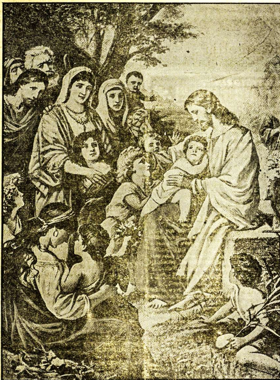
V. JEZUS LAIMINA VAIKELIUS.

(Leiskite mažutėlius pas mane, nes jų yra dangaus karalystė.)