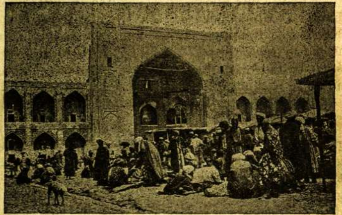
Medresa Ulug Bek Samarkande.

Apleidę tuos stebėtinus senovės azijatų griuvėsius, kurių gražylas žemės drebėjimai metis po metui baigia naikinti, sugrįžome prie vežėjų ir nuvykome į garsų Samarkando „rigistaną“, tariant viešąjį pliacių. Tas rigistanas senovėje buvo žinomas kaip didžiausias pasaulyje pliacius; jį apjuosiančios iš trijų šonų arabiškosios struktūros amžiais buvo pavyzdžiu architektams, įkvėpimu archeologams ir istorikams, patogiausia vieta suėjimams, mainikavimams ir atlikimui visokių reikalų. Ketvirtas jo šonas atviras. Cia įtaisyta įvairiausių prekių pardavyklos. Sartai į prekybą žiūri kaip į parankiausia pralobimo ir išsilygėjimo į-