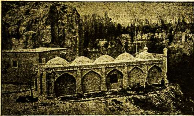
Kapas šv. Danieliaus ties Samarkandu.

didelės mahometonų, taipgi žydų meldžionijos ateina ant kapo pasimelsti. Pranašas Danielius gyvenęs apie 600 metų pirm Kristaus gimimo. Kaip vergas buvo paimtas į Babilioniją, bet mokėdamas išaiškinti karaliaus sapnus, ir jog buvo mokytas, greit pastarojo įgijo malones. Prie Nabuchodono-