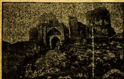
Mečetė Šah Zinde Samarkande.

bi Chanum mečetės stovi jau pusėtinai apiręs Tamerlano pačios mauzoleum'as. Cia ji palaidota po murmuliniu antkapiu, ant kurio išbriežtas arabiškai parašas. Plačiame mečetės triobesiu kieme stovi didžiulis iš akmens rūpestingai iškarbuotas pulpitas koranui pasidėti. Jis turi dešimts pėdų augščio ir dvidešimts pločio. Tokio dydžio, sako, buvus ir korano knyga, iš kurios mullos skaitydavo susirinkusiems čia meldžioniems. Taipgi tų triobesiu srityje buvęs ir Tamerlano rūmas, tik dabar sunku atsižinoti, kurioje tikrai vietoje.