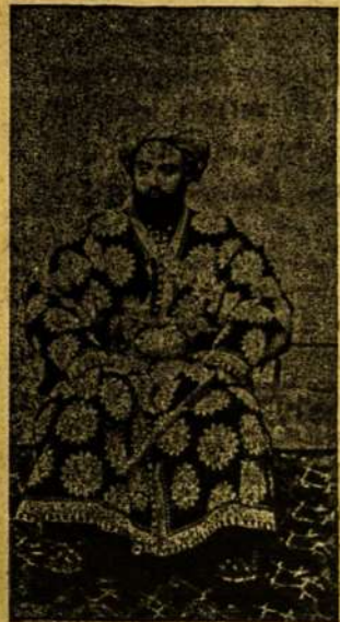
Bucharos Emiro premijeras.

Vartai niekuomi neimponuoja. Vienatinis jų papuošalas, — tai didelis viršuje laikrodys. Laikrodžius buchariečiai skaito dar ne by kokia reteny-