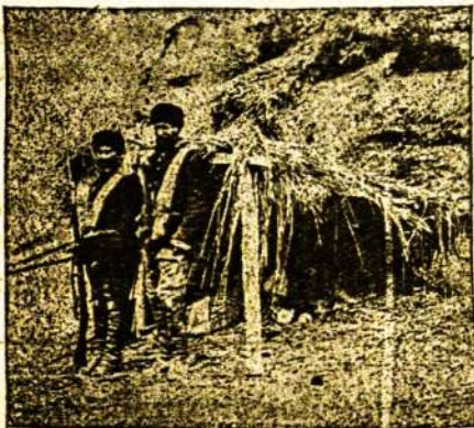
Zindanc sargyba Bucharoje.