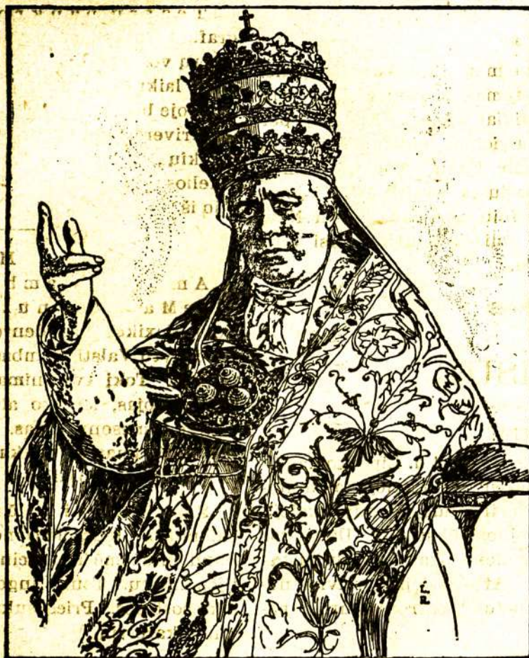
SVENTASIS TEVAS PIUS X.

Kelinta diena popiezius Pius X, labai sunkiai serga. Nekurie gydytojai tikisi Jo Sventenybę pasveiksiant; kiti gi sprendžia kad pagijimui vilties jau nebėsa.