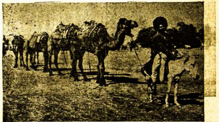
Turkmenas su karavana Bucharoje.

Bet grįžtu prie savo kelionės. Apleidus Bucharos senąjį miestą, prieš mus atsidendė šilkmedžiais išsikaišiusios medvilnės bei ryžių dirvos, vilgomos upės Zarafšano kanalų vandeniu. Tą upę čia buviai vadina aukso barstytoja, ir toks alegorinis jos užvardis nei kiek neperdėtas. Josios vandens, tekėdami nuo Hindu Kušo kalnų, duoda žemei daugiau maisto vasarą, ypač liepos mėnesyje, kada tirpsta sniegai nuo kalnų viršūnių. Jos smulki kanalizacijos sistema, tarytum, gislos arterija, išsišakojus sriovių sriovelėmis, apdrėkina du šimtu penkiasdešimts angliškųjų mylių žemės plotą rusų Turkestane. Jos gi vingiuota juosta toje šalyje turi keturis šimtus dvidešimts šešias angliškas mylias ilgio. Pavasariais ji pavirčia tyrus puikiausiais javų laukais, ganevomis, daržais. Medvilnės sodybos užvis daugiausia naudojasi Zarafšano vandenimis, nes didesnė žemdirbių dalis užsiima medvilnės auginimu. Sio produkto nebejuokais pradėjo rūpintis Rusija pastarais laikais ir tuo tikslu žada kanalizaciją išskėsti kaplačiausia po Turkestano erdvietes. Iš medvilnės Bucharos gyventojai dirba gražius audimus, aliejų, taipgi sikės, kuriomis šeria kupranugarius. Bucharoje auga ir turkiškieji pipirai.