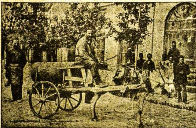
Kerosino pardavėjas Bucharoje.

Aplinkui juos apstoję islamo išpažintojai klausosi maldingai ir kaip kurie net verkia. Nepaisant tos nedraugiškos krikščioniems misijos, čaichanoje su mudviem apsjeita kamandagiausiai. Apspite mus iš visų pusių mėgino kalbinti, bet vargas, kad nieko iš jų kalbų negalėjome suprasti, o pirštais susižinoti ir gi nelengva. Viens uzbekas, išlinksminęs, nusiėmė nuo galvos savo čalmą ir visą išvyniojo, kad parodyti kokio ji ilgio. Aš ėmiau ją matuoti ant alkūnės ir suskaičiau penkiolika mastų to balto, plonučio audimo. (Mirus muzulmonui, jo kūną nevelka marškiniiais, bet apvynioja jo paties čalma). Ant viršugalvio turėjo labai gražią žibučiais išaustą kepuriukę „tibiteika“. Pasi-drašinus, paprašiau, kad ją man duotų pasimieruoti. Juokdamos, nusiėmė ir padavė, o kad jo nuskusta galva liko niekuo nepridenyta, pamėginau uždėt jam savo skrybėlę. Tuo pačiu laiku kampe sėdįs mulla prie virdulio jam pagrūmojo, ir tas griežtai atsisakė. Supratau, kad toks „šposas“ jiems neleistinas, tad greit ir aš sugražinau linksmam uzbekui visus jo galvos papuošalus. Kiti rodinėjo savo žiedus su pastebėtinai dideliais akmenais. Tik, kiek man rodos, retas tų blizgučių yra tikras akmuo,—daugiausia tai gražiai padirbti stikliukai. Pasidrūtinusios ir užmokėjusios, tartum, vien dėl formos, nes taip mažai paėmė, pasijieškojova truputį rusiškai suprantanti vežėją kirgizą ir liepėva nugabenti mudvi į stotį. Ark-