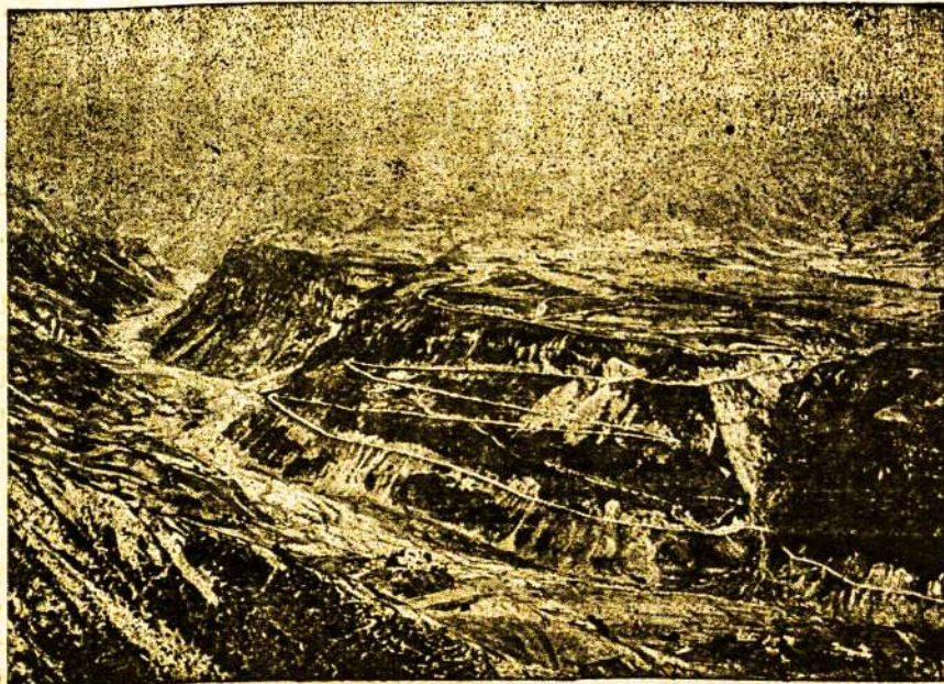
Kariškasis Gruzinių Kelias — Mletų nuolaidis nuo Mtiuleto kalnų.